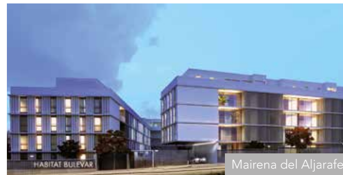
Mairena del Aljarafe